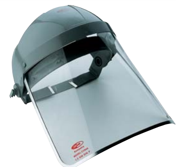
945070 + 945075

Kat.-Nr.: 945075 = Polycarbonatscheibe, besonders geeignet für Splitterbereiche. Scheibengröße: 200x200 mm. Ohne Kopfhalterung.